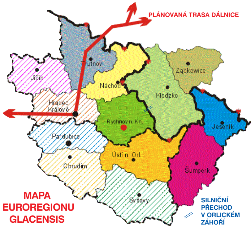
MAPA EUROREGIONU GLACENSIS