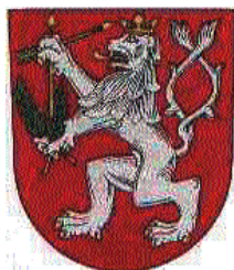
KOSTELEČ N. O.