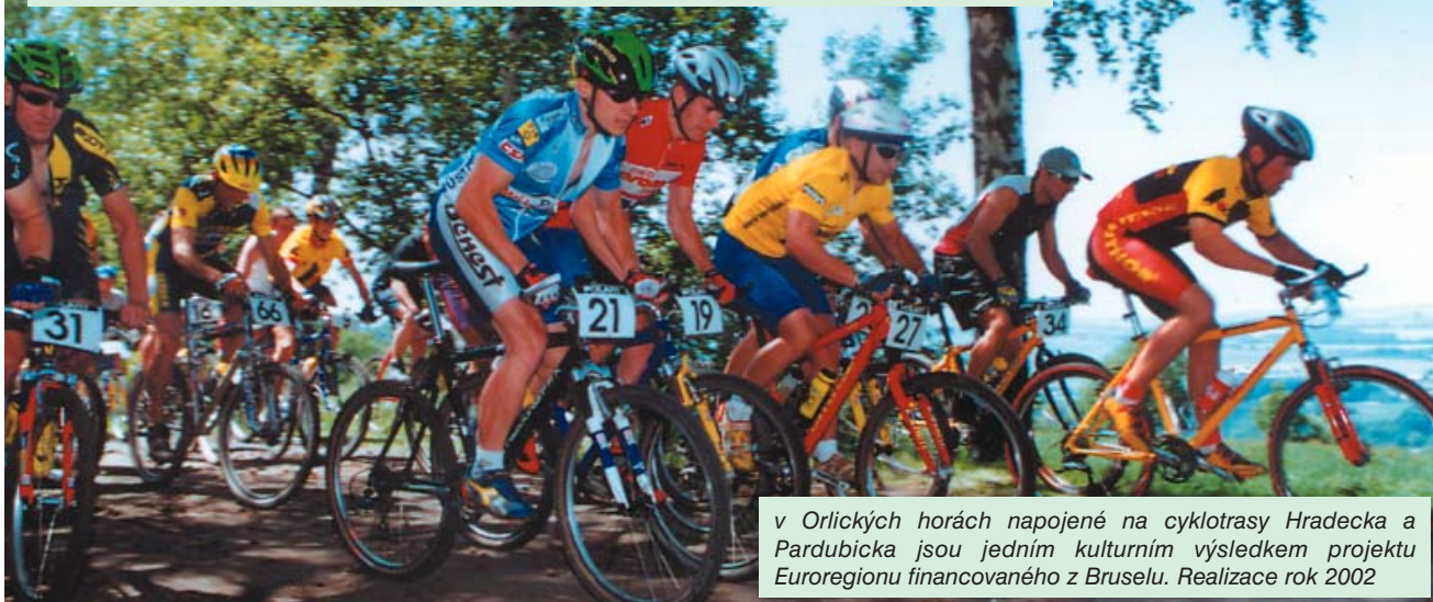
v Orlických horách napojené na cyklotrasy Hradecka a Pardubicka jsou jedním kulturním výsledkem projektu Euroregionu financovaného z Bruselu. Realizace rok 2002