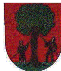
ROKYTNICE V O.H.