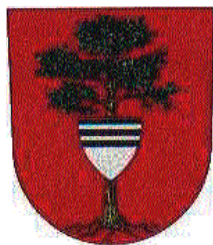
TÝNIŠTĚ N. O.