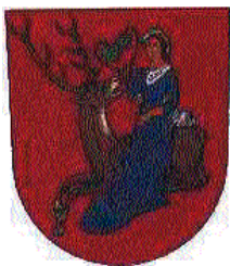
RYCHNOV N. KN.